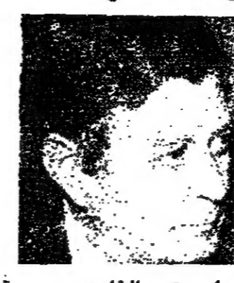
ديان وزير الخارجية الاسرائيلي اعلن فيها عن قرب التوصل الى اتفاق حول اعلان مبادىء

القوس - ديا - تواصلت الولايات المتحدة جهودها المكثفة لسد الفجوة بين اسرائيل ومصر في محادثاتهما السياسية والعسكرية ويهدف استئناف تلك المحادثات . وقد اجري الفريد اثرتون وكيل وزارة الخارجية الاميركية لشؤون الشرق الاوسط محادثات مطولة مع مناحم بيغن رئيس الوزراء الاسرائيلي وموشي دايان وزير الخارجية وعزرنه وايزمان وزير الدفاع في محاولة لتخفيف الخلافات بين القاهرة والقوس .